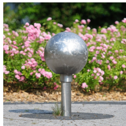
50000062 verende kogel