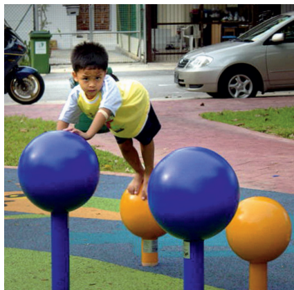
50000052/50000054 kleine en grote kogels