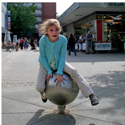
50000061 grote draaikogel

1 kogel resp. kogelcarroussel 1 funderingsanker