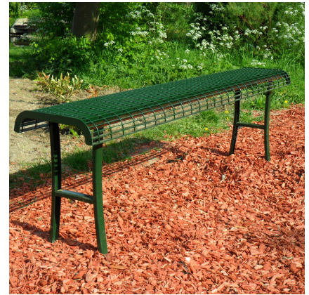
8.330 dubbelzijdige roosterkrukbank, L 2,00m