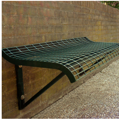
8.340 roosterkrukbank, wandmodel, L 2,00m