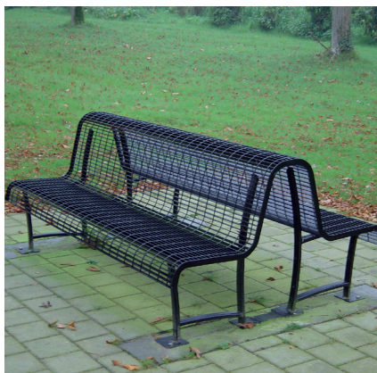
8.320 dubbelzijdige roosterzitbank, L 2,00 m