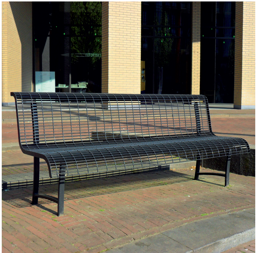
8.300 roosterzitbank, L 2,00 m